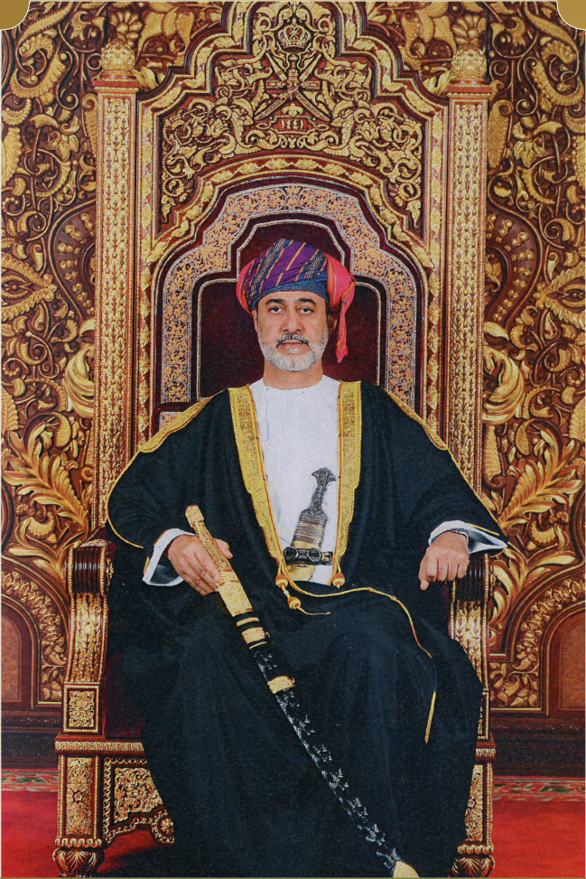
حضرة صاحب الجلالة السلطان هيثم بن طارق المعظم - حفظه الله ورعاه