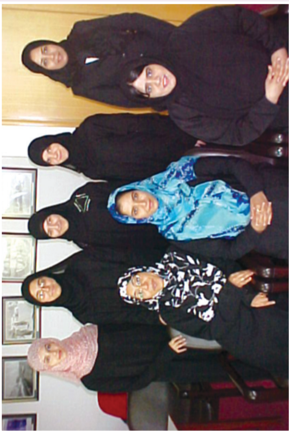
المشاركات مع المتطوعات