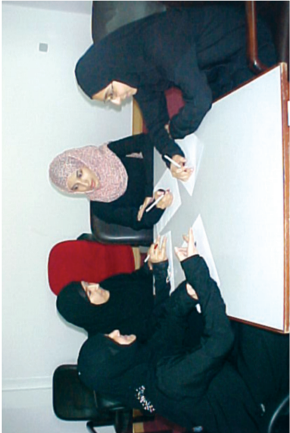
الطالبات أثناء الحلقة النقاشية