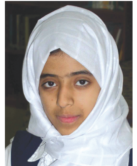
بشائر جمعة المخينية