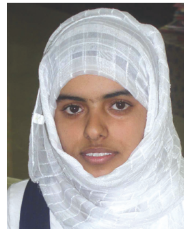
زمنم سالم الغريمية

والمشاركة الجماعية بالإضافة إلى تعويد الطالبات على كيفية بناء علاقات اجتماعية مع أفراد المجتمع المدرسي والخارجي على وجه العموم.